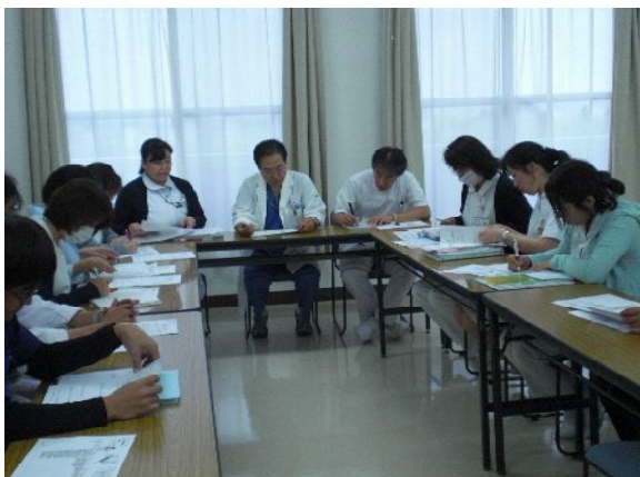
【医療安全小委員会風景】

活動をわかり易く紹介するために、毎月各部署の5S活動を写真入りで掲示してきました。最終目標は①物を探す無駄をなくし、医療ミス・業務ミスを低減する。②限られたスペースを有効に活用する。③決められたルールを守る組織を作る。としています。より良い療養環境を病院全体で考え実現できるように、医療安全対策を組織横断的に活動しています。