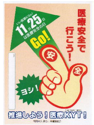
【医療安全推進週間ポスター】