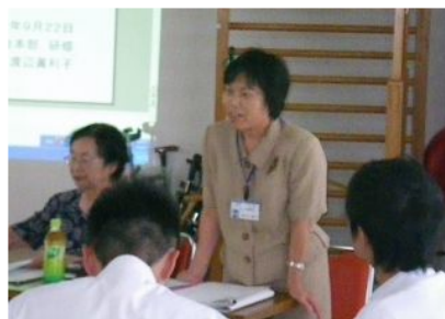
【全体オリエンテーション 法人本部 湯ノ口企画研修課長】