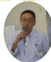
末盛施設長の挨拶

当日には、近隣保育園の園児13名と先生4名もお祝いに駆けつけてくれ、アンパンマン体操や合唱などを披露してくれました。参加した利用者の方は、リズムに合わせて手や足を動かしたり、口ずさんだり・・・とても和やかなひとときを過ごすことができました。保育園のみなさん、ありがとうございました。